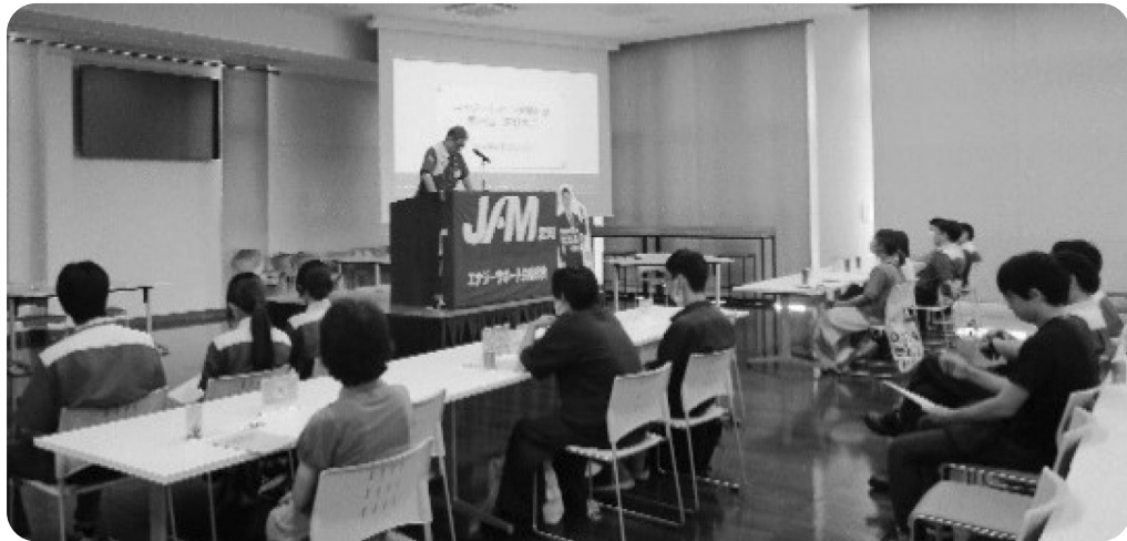
開会宣言をする柳田副執行委員長

また今回から初の試みとして組合員皆様に参加いただけるよう、手話通訳の方を招きました。