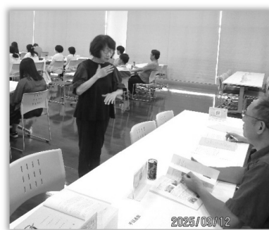
▲今回も引き続き、手話通訳の方をお招きしました